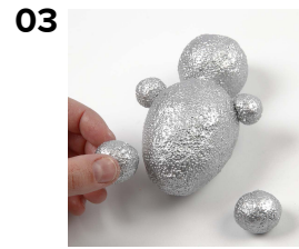
Pyöritä palloja ja kiinnitä jaloiksi.