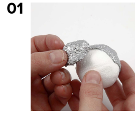
Päällystä styroxpalo helmimassalla.

Veikeät pääsiäiseläimet tehtiin styroxpaloista ja -munista, jotka päällystettiin metallic-helmimassalla. Korvat, siivet ym. tehtiin helmimassasta, joka kaulittiin litteäksi, annettiin kuivua, leikattiin muotoon ja "liimattiin" eläimeen helmimassalla.