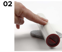
Kauli helmimassapallo ohueksi ja anna kuivua.