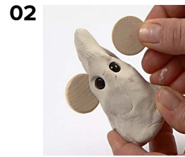
02 Työnnä saveen helmisilmät ja puunappikorvat.