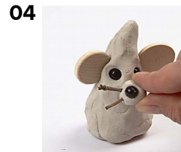
04 Työnnä kuono paikoilleen silmien alle.