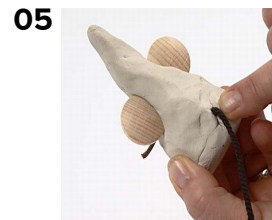
05 Kiinnitä musta puuvillalanka hännäksi. Anna kuivua.