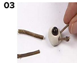
03 Pyöritä pieni savipallo ja työnnä siihen pieniä oksanpätkiä viiksiksi ja helmi kuonoksi.