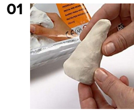
01 Muotoile kartio itsekovettuvasta savesta.

Nämä hauskat pienet jouluhiiret on muotoiltu itsekovettuvasta savesta. Silmät ja kuono on tehty puuhelmistä. Korvat on tehty puunapeista ja viikset pienistä oksan pätkestä.