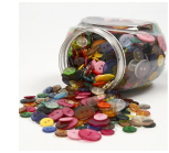
Nappilajitelma, 12+18+20 mm, 800.00 Kpl 40381