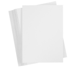
Kartonki, A6, 105x148 mm, 180 g, Valkoinen, 100 Ark 21810